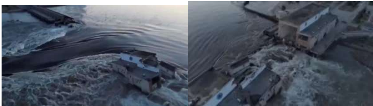
Illustration 2 : brèche dans le barrage de Kakhovka

Fonds de carte OpenStreetMap – mardi 6 juin 2023