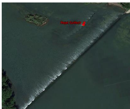
Illustration 3 : stations amont et aval du CNPE de GOLFECH