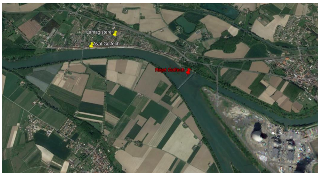
Illustration 2 : gros plan sur les buses de rejet du CNPE de GOLFECH