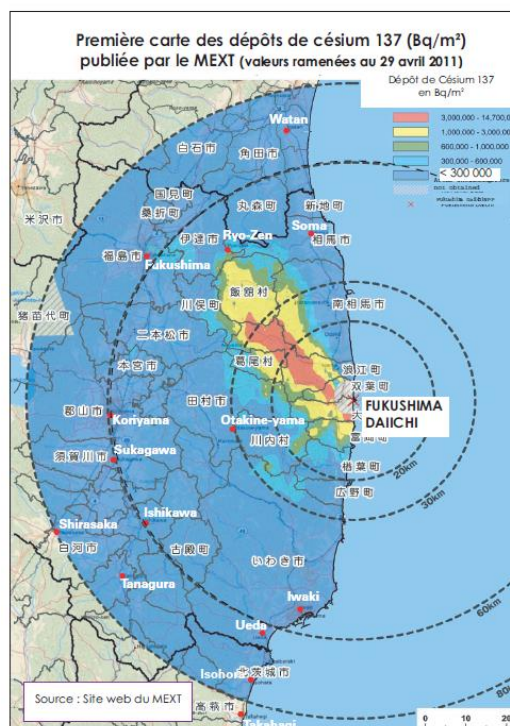
Première carte des dépôts de césium 137 (Bq/m 2 ) publiée par les autorités japonaises, zone des 80 km : valeurs ramenées au 29 avril 2011

catastrophe de Fukushima. Elle a été publiée par les autorités japonaises le 6 mai 2011 . On constate que la contamination s'étend bien au-delà du périmètre d'évacuation de 20 kilomètres (1 er cercle). Dans la zone de 30 à 60 km, en particulier au nord-ouest de la centrale, des territoires ont reçu des dépôts de césium 137 estimés entre 1 et 3 millions de Bq/m 2 (couleur jaune).